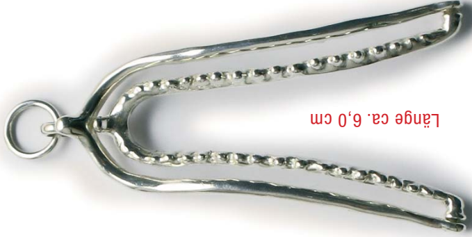
Modell LS 03